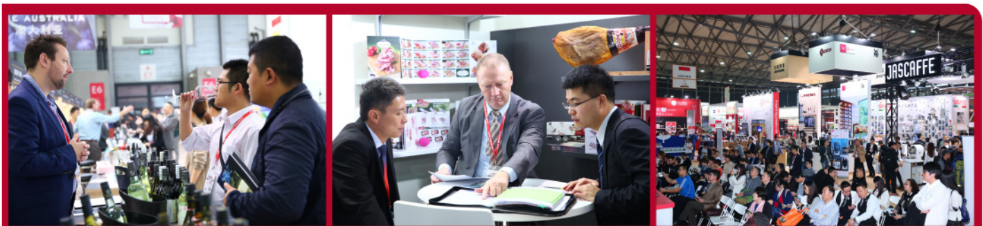
商机，贸易洽谈和培训尽在FHC 2015

FHC和ProWine China 盛会将于2016年11月7-9日再度回归上海。在见证今年展会的丰硕成果后，主办单位预计明年将迎来更大规模的贸易盛会。